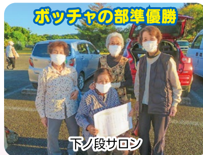
ボッチャの部準優勝