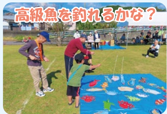
高級魚を釣れるかな?