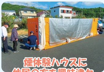
煙体験ハウスに 住民の方も興味津々。

11月3日(金)に第7回ニコニコ公園ニコニコまつりが開催されました。毎年、文化の日に三崎浦地区で開催しており、地域住民の交流を目的に防災活動なども組み込んだイベントとなっています。