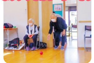
ポッチャではリーダーです

上とは思えないほど立派です。10年ほど前に大きな手術を2回も経験されたそうですが、それをまったく感じさせないほどお元気です。