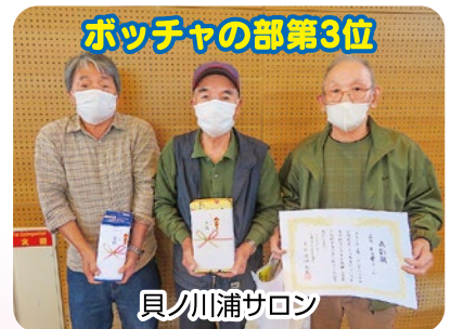
ボッチャの部第3位