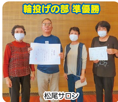
輪投げの部 準優勝