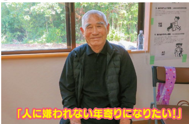
「人に嫌われない年寄りになりたい!!」