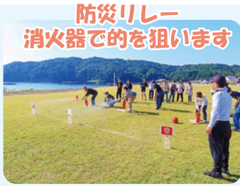
防災リレー 消火器で的を狙います