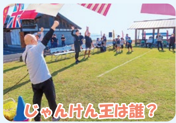
じゃんけん王は誰?