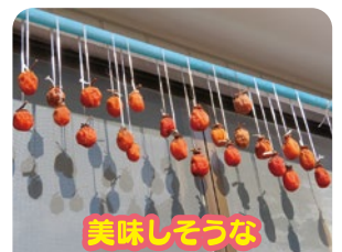
美味しそうな 干し柿もお手製です