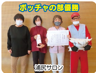
ボッチャの部優勝